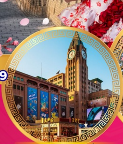
ถนนคนเดินหวังฝูจิ่ง

เที่ยวย่านการค้าดังกลางกรุงปักกิ่ง ถนนคนเดินหวังฝูจิ่ง จัตุรัสเทียนอันเหมิน พระราชวังกุ่กิง หอฟ้าเทียนถาน ช้อปปิงย่านซานหลี่ถุน พระราชวังฤดูร้อนอวี่เหอหยวน กำแพงเมืองจีนด่านอวิหยงกวน ชมซากุระบาน สักการะวัดลามะ