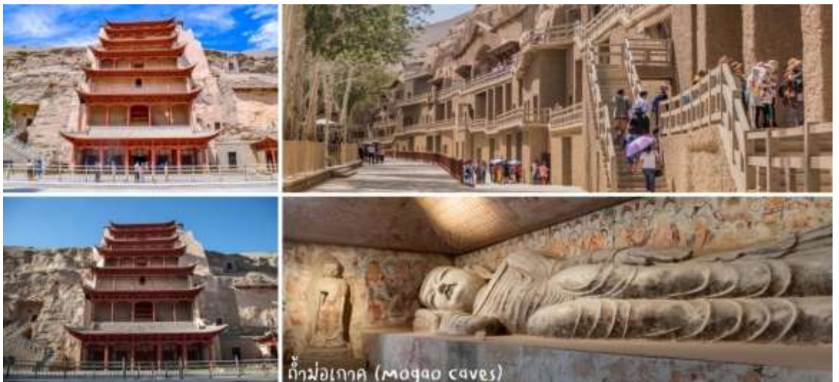
ถ้ำม่อเกาอู (Mogao caves)

จากนั้นนำท่านชม ถ้ำม่อเกาอู (Mogao Caves) อยู่บริเวณหน้าผาของเขามิงซาซาน หรือที่รู้จักกันในชื่อ "ถ้ำพระพุทธรูปพันองค์" เป็นหนึ่งในศาสนสถานและแหล่งพุทธศิลป์ที่ยิ่งใหญ่และมีชื่อเสียงที่สุดของจีน ตั้งอยู่ที่เมืองตุนหวง มณฑลกานซู่ ทางตะวันตกเฉียงเหนือของประเทศจีน เริ่มสร้างขึ้นตั้งแต่ศตวรรษที่ 4 (ประมาณปี ค.ศ. 366) และมีการสร้างต่อเนื่องยาวนานกว่า 1,000 ปี ผ่านราชวงศ์ต่างๆ กว่า 10 ราชวงศ์ ภายในถ้ำประกอบด้วยจิตรกรรมฝาผนังเนื้อที่รวมกว่า 45,000 ตารางเมตร และรูปปั้นสีมากกว่า 2,000 องค์ ซึ่งสะท้อนถึงศรัทธาและความประณีตในแต่ละยุคสมัย : เป็นสถานที่ค้นพบ "ถ้ำเก็บพระคัมภีร์" (Library Cave) ซึ่งบรรจุเอกสาร คัมภีร์ และโบราณวัตถุสำคัญกว่า 50,000 รายการ ได้รับการขึ้นทะเบียนเป็นมรดกโลกโดย UNESCO ในปี พ.ศ. 2530 ในฐานะแหล่งรวมพุทธศิลป์ที่สมบูรณ์ที่สุดแห่งหนึ่งของโลก (รวมรถให้อูทยาน+ใช้ตัวประเภท B)