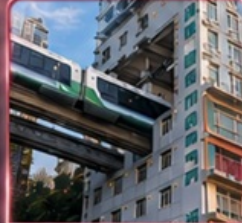
นั่งรถไฟทะลุศึก 2 สถานี