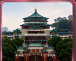
ศาลาประชาม (ชมด้านนอก)