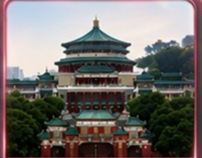
ศาลาประชาชน (ชมด้านนอก)