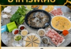
ชาบูเห็ด