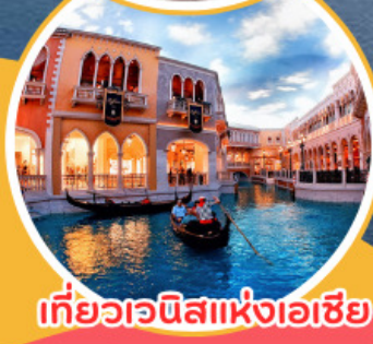
เที่ยวเวนิสแห่งเอเชีย