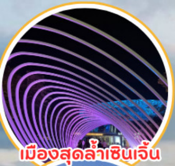
เมืองสุดล้าเซ็นเจิ้น