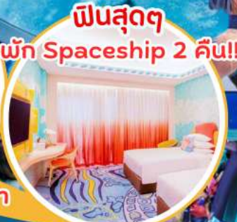
ฟินสุดๆ พัก Spaceship 2 คืน!!