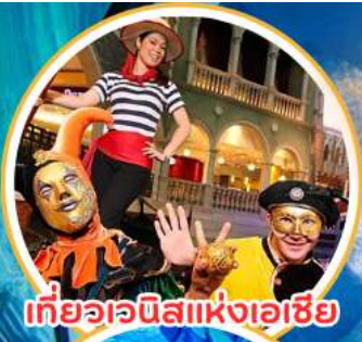
เที่ยวอะนิเมะแห่งเอเชีย