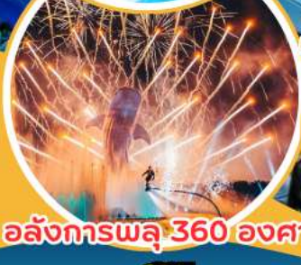
อลังการพลุ 360 องศา