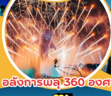
อลังการพลุ 360 องศา