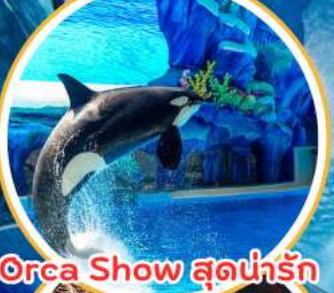
Orca Show สุดน่ารัก