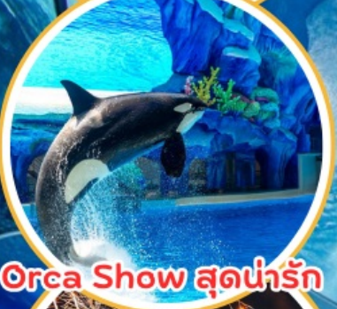
Orca Show สุดน่ารัก