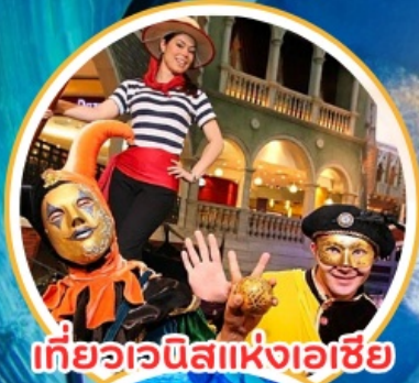
เที่ยวอะนิสแห่งเอเชีย