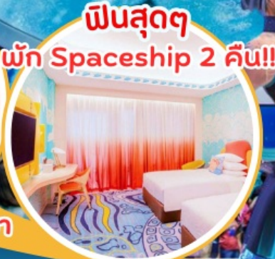
ฟินสุดๆ พัก Spaceship 2 คืน!!