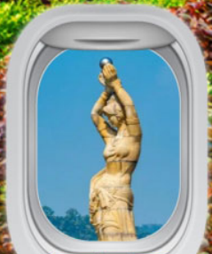
หวิ่หนี่