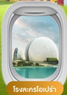
โรงละครโอเปร่า