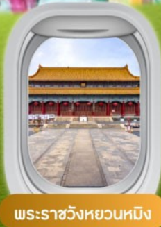
พระราชวังหยวนหมิง