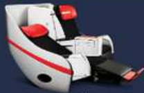
**อพเทค ณ วันที่ 26/02/67**