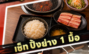
เช็ก ปิ้งย่าง 1 มื้อ