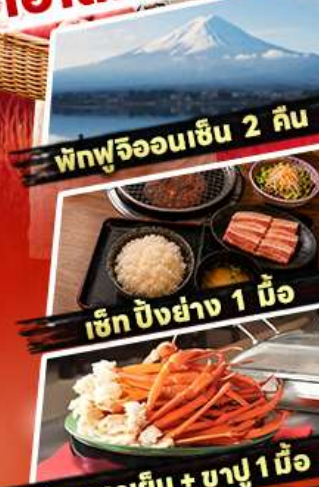
พิฆฟูจิออนเซ็น 2 ถิ่น