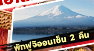
พิพฟูจิออนเซ็น 2 ถิ่น