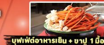
บุฟเฟ่ต์อาหารเย็น + ชาปู 1 มื้อ