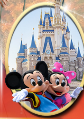
อิสระเลือกซื้อบัตร Tokyo Disneyland

รหัสทัวร์ RJ-XJ134 เส้นทาง 5D 3N ท.ย. - ต.ค. 2569