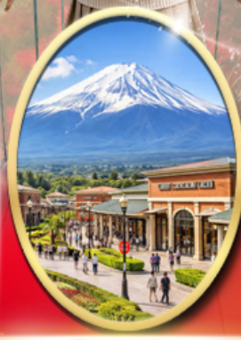
Gotemba Premium Outlets