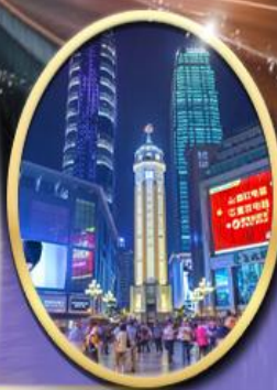
ถนนคนเดินเจี๋ยฟางเป็ย