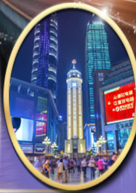
ถนนคนเดินเจียฟางเป็ย