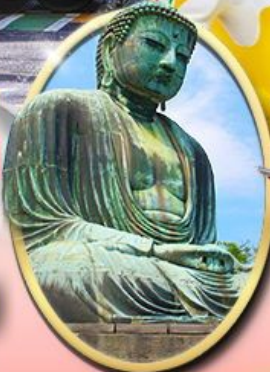
พระใหญ่คามาคุระ