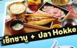
เอ๊กซาซุ + ปลา Hokke

36,919 ราคา เริ่มต้น บาท รวมภาษีมูลค่าเพิ่ม 7%