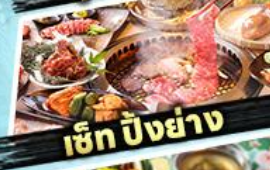
เอ๊ก บิงย่าง