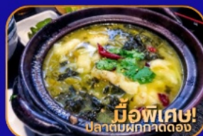
มีอพิเศษ! ปลาต้มผักกาดดอง