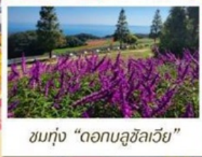
ชมทุ่ง "ดอกบลูซิลเวีย"