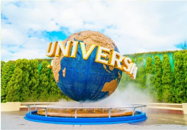
UNIVERSAL STUDIOS JAPAN