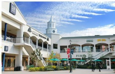
SHOPPING AT RINKU PREMIUM OUTLET