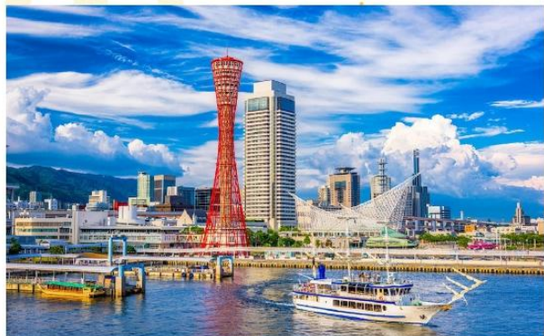
KOBE PORT TOWER