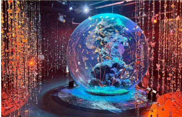
KOBE AQUARIUM ATOA