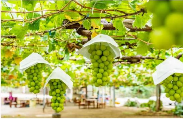
SHINE MUSCAT FARM AT KATSURAGI