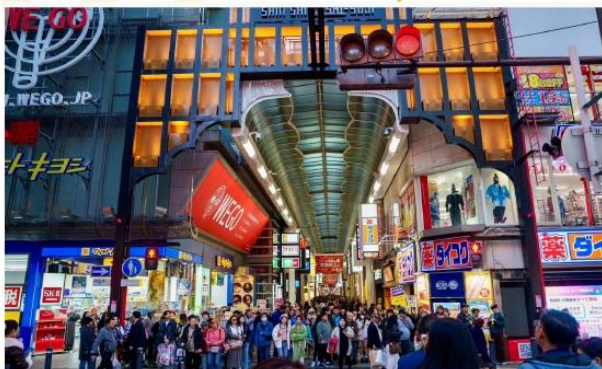
SHOPPING AT SHINSAIBASHI

เดินทางเข้าสู่ “เมืองโอซาก้า” จังหวัดโอซาก้า เพื่อตะลุย “ย่านช้อปปิ้งชินโซบาชิจน” ถนนสายการค้าสุดฮิตและคึกคักที่สุด อิสระให้ท่านเดินช้อปปิ้งละลายกรีพธ์กับร้านค้ามากมายที่เปิดเรียงรายยาวเหยียด อปเปคเทรดนั้แพชั่นแบรนด์ดัง เลือกซื้อเครื่องสำอางญี่ปุ่นยอดฮิต หรือแวะชิมสตรีทฟู้ดแสนอร่อยตามตรอกซอกซอยได้อย่างจุใจ ถือเป็นสวรรค์ของนักช้อปปิ้งให้ท่านได้เพลิดเพลินกับสีสันของมหานครโอซาก้าอย่างเต็มที่