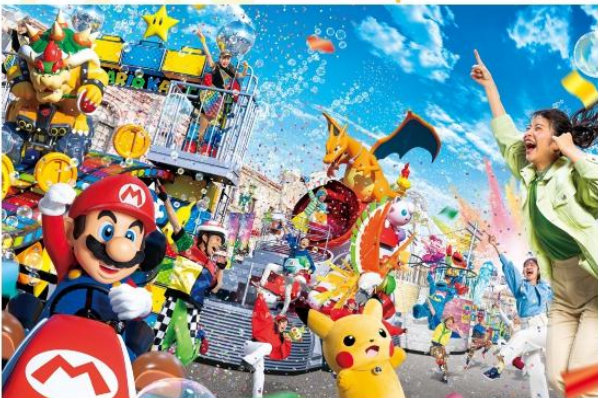
SUPER NINTENDO WORLD

นอกจากนี้ยังมีโซนยอดนิยมอื่นๆ เช่น Minion Park, Jurassic Park, Hollywood, New York และ Amity Village ที่พร้อมมอบความสนุกให้กับทุกคนในครอบครัว