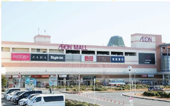
SHOPPING AT SENNAN AEON MALL

อิสระอาหารกลางวันตามอริยาศัย (รับเงินคืนจากบัตรคูปอง 2,000 เยน)