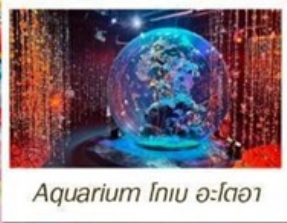
Aquarium โทเบ อะโตอา

📦 หนัก 23 KG. x2 ( รวม 46 KG. ) ทั้งไป - กลับ