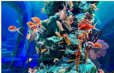
KOBE AQUARIUM ATOA