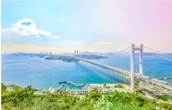
AKASHI KAIKYO BRIDGE & AWAJI HIGHWAY OASIS