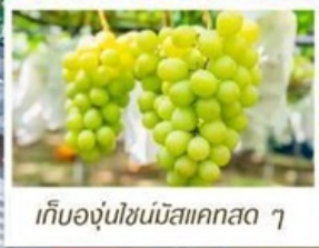
เก็บองุ่นไซน์มิสแคสตา ๗

🇯🇵 เอเชียโทกะ - โอซาก้า (รวมบัตรเข้าสวนสนุก USJ)