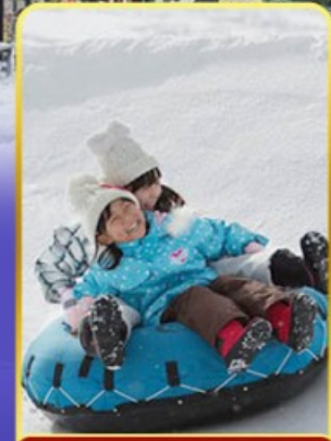
กิจกรรม น ลานสกี