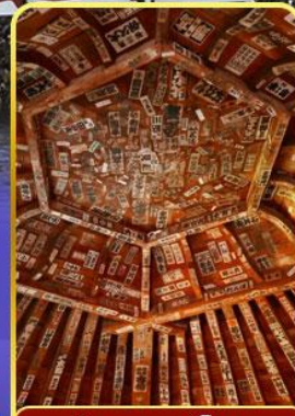
วัดซาอะเอโดะ