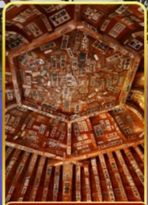
วัดซาเซเอโดะ