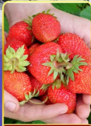
กิจกรรมเก็บสตอเบอร์รี่