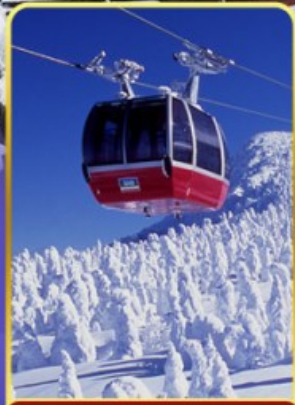
นั่งกระเช้าขึ้นเขาซาโอะ