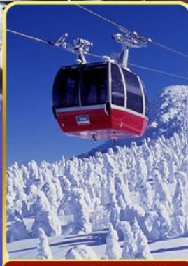
นั่งกระเช้าขึ้นเขาซาโอะ