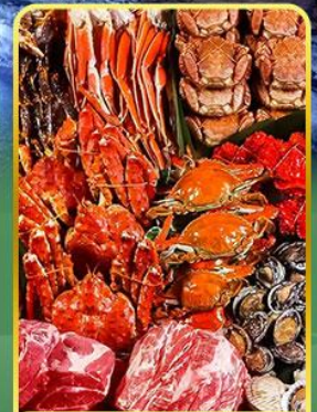
ปิ้งย่างพรีเมียมมันตะ