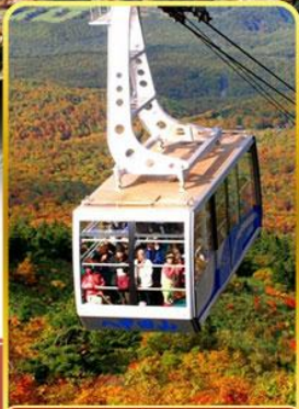
นั่งกระเช้าอากิโกดะ