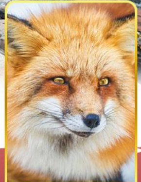
ฟาร์มสุนัขจิ้งจอก

ออนเซ็น 4 คืน นน.กระเป๋า 23 กก.X2 8Days 5Night