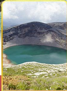
ปากปล่องภูเขาไฟซาโอ