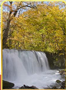
ลำธารโออิราเสะ