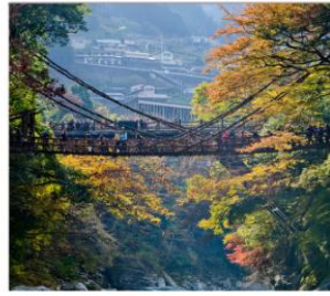
ชมสะพานคะชิระมาชิ