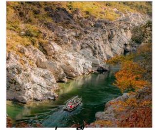
ล่องเรือชม ขุนเขาโอบิโนะคะ