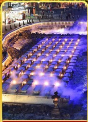
ชมยูบาตากะ