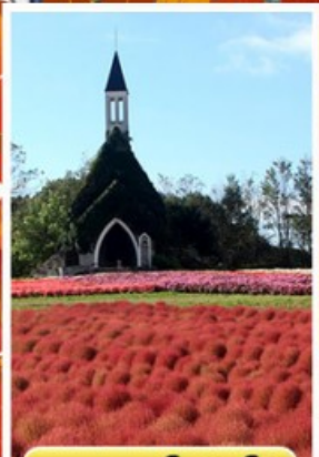
สวนบกกะโนะซาโตะ