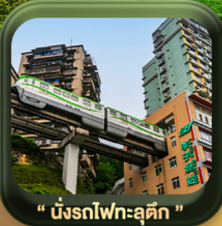
“ นั้งรถไฟทะลุคิก ”

บินตรงลงจงซิ่ง • อุ๋หลง หลุมฟ้าสะพานสวรรค์ • ระเบียบแก้ว • อุทยานเขานางฟ้า หงหยาดัง • นั้งรถไฟทะลุคิก • ศาลาประชาคม (ด้านนอก) • หลงหมินฮ่าว มรดกโลกผาหินแกะสลักต้าจู้ • วัดหลัวฮั่น • ตึกตะเกียบ • ถนนคนเดินเจียฟางเป่ย์