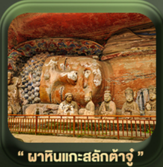
“ ผาหินแกะสลักต้าจู้ ”

วันเดินทาง มี.ค. - ต.ค. 2569 ราคาเริ่มต้น 22,999.-