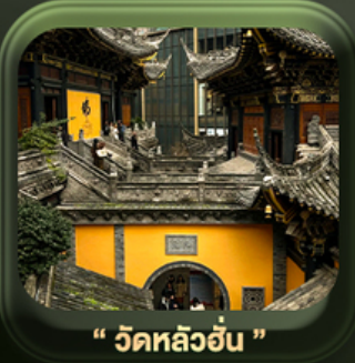
“ วัดหลัวฮั่น ”