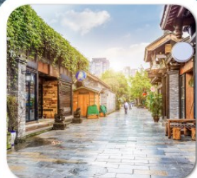
"ชอยกว้างชอยแคบ"