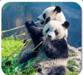
"ศูนย์หมีแพนด้า"