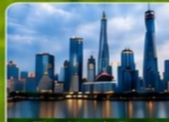
The North Bund Greenland