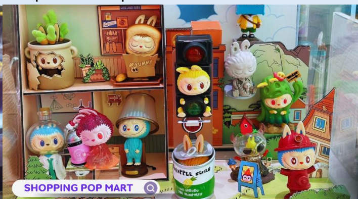
POP MART ช้อปปิงถนนหนานจิง