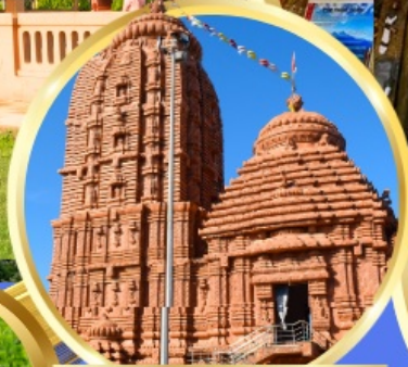
เทวาลัยศรีจักรนารท แห่งตีบูรกาห์