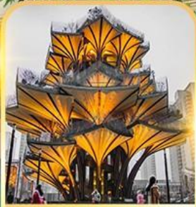
ต้นไม้แห่งชีวิต