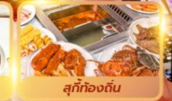
สุกี้ท้องถิ่น