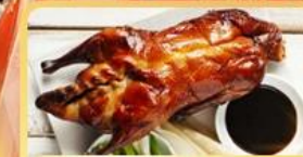
เป็ดย่าง