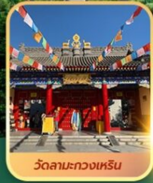
วัดลามะกวงเหริน