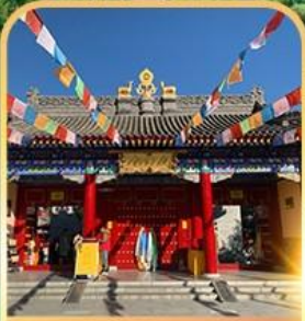
วัดลามะกวงเหริน