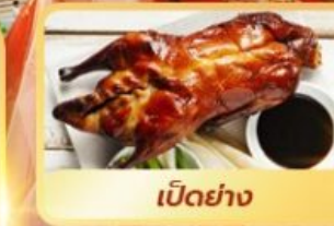
เป็ดย่าง