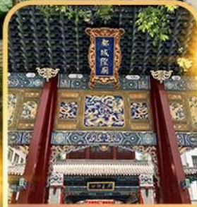
ศาลหลักเมือง