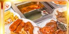
สุกี้ท้องถิ่น