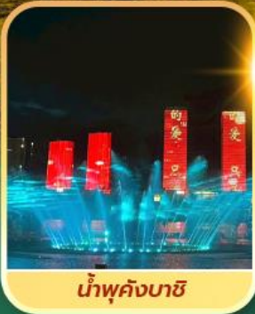
น้ำพุคังบาชิ