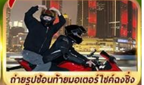
OPTION!! ถ่ายรูปขี่มอเตอร์ไซด์ลงซิ่ง