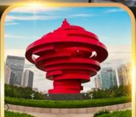
จตุรัสหาลี้