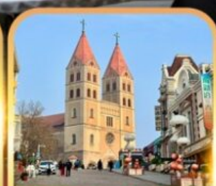
โบสถ์เซ็นต์ไมเคิล