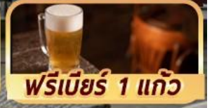
ฟรีเบียร์ 1 แก้ว