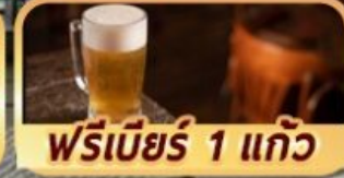
ฟรีเบียร์ 1 แก้ว