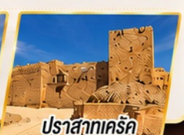
ปราสาทเคร์ค