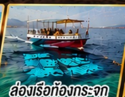
ล่องเรือท้องกระจก