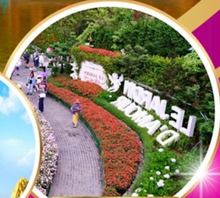
Le Jardin d'Amour