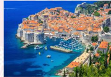
เมืองดูบรอฟนิค