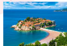
หมู่บ้านสเวติ สเตฟาน