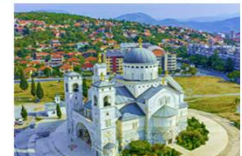
Cathedral of the Resurrection of Christ

20.40 น. ออกเดินทางสู่สนามบินอิสตันบูล เที่ยวบิน TK1088