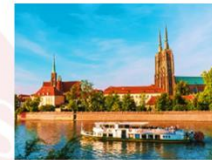
ล่องเรือชมเกาะทิมสกี

** พักที่ HP Plaza Hotel 4* หรือเทียบเท่า **