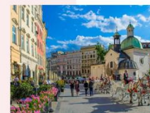
เมืองคราคูฟ

** พักที่ Golden Tulip Krakow Kazimierz Hotel 4* หรือเทียบเท่า **