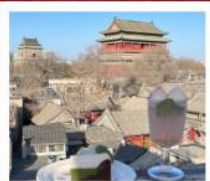
คาเฟ่ น้ำตาล