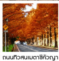
ถนนทิวสนเมตาชิคิวญา