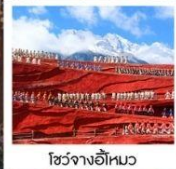
โซ่วจางอีหมว