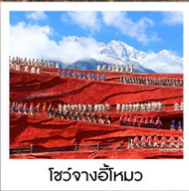
โซ่วจางอีไห่

พิเศษ!! รวมค่าเช่าชุดพื้นเมือง ...ที่เมืองโบราณลี้เจียง