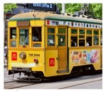
นั่งรถรางต้าเหลียน