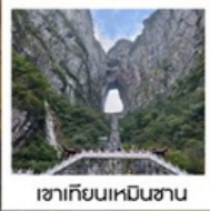
เขาคิยงเหินชาน

พิเศษ!!...รอบค่ำเช้าชุดพื้นเมืองที่ฟ่งหวง • รอบค่ำช่างถ่ายรูป น้ำตกฟูหรง