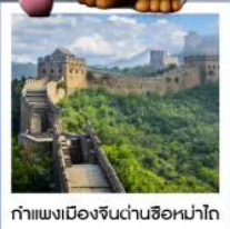
กำแพงเมืองจีนด่านซือหม่าไท่

เมืองโบราณกุ่เป่ย์สู่ยจิ้น / กำแพงเมืองจีนด่านซือหม่าไท่ (รวมค่ากระเช้าขึ้น-ลง) / ชมวิวกำแพงเมืองจีนและเมืองโบราณ ยูนิเวอร์แซลปักกิ่ง (รวมค่าบัตรเข้า) / จัตุรัสเทียนอันเหมิน / พระราชวังโบราณกู้กง / หอบูชาเทียนถาน คาเฟ่กาแฟบ้านน้ำตาล (TANG FANG CAFE) / พระราชวังฤดูร้อนอวิ๋เหอหยวน / ย่านชานหลี่ถุน (POP MART) / ถนนคนเดินไท่กู่หลี่