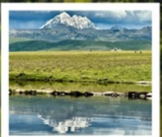
ดวงตาแห่งต่าง

หมู่บ้านทิเบตเจียงจวี • จุดชมวิวกุหลาบหิมะหย่าลา • ปาหล่มย สวนหินปาหล่มย • จุดชมวิวดวงตาแห่งต่าง • วัดมู่หย่า หมู่บ้านเกอริ้อูหม่าซุน • ซินตูเจียง • หมู่บ้านกุน่งซุน หมู่บ้านปาหลางเจียงตู • เมืองลอยฟ้าเกอเตี๋ลามู • ภูเขาจ้อตั่วซัน ถนนสายรุ้ง • ทะเลสาบแดง • ถนนคนเดินชอยกวางแคบ