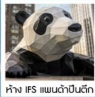
ห้าง IFS แพนด้าป็นตึก