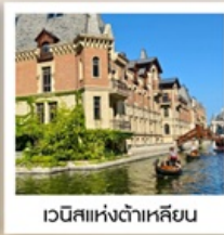
เวนิสแห่งต้าเหลียน