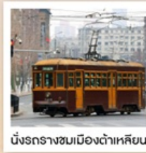
นั่งรถรางชมเมืองต้าเหลียน