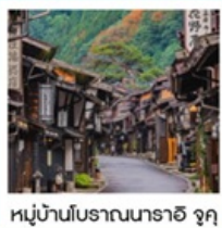
หมู่บ้านโบราณนารายิ จุกุ