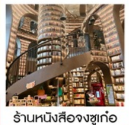
ร้านหนังสือจงซูก่อ

ศูนย์อนุรักษ์หมีแพนด้าตุเจียงเยียน (รวมรถแบดเตอร์) / ร้านหนังสือจงซูก่อ / จตุรัสหย่างเทียนวู / รูปปั้นหมีแพนด้าเซลฟี / เมืองโบราณก่วนเซียน ที่ทำกาารไปรษณีย์หมีแพนด้า (PANDA POST) / ถนนคนเดินซุนซีลู่ / ห้าง IFS แพนด้าบิตติก / Chengdu Eastern Memory / ถนนคนเดินไท่กู่หลี่ / ห้าง SKP