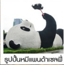
รูปปั้นหมีแพนด้าชหลี่