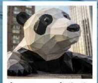
ห้าง IFS แพนด้าป็นตึก