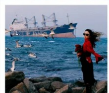
เรือควิวส

หอคอยทาลเวลา / รูปปั้นปลาวาฬ / ถนนโบราณเตาหยาง / ย่านสงโงว 1920 / เมืองเว่ยไห่ / ถนนฮัวจวิปา / จตุรัสประตูแห่งความสุข ย่านอันลอฟาง / เรือควิวส / หาดซาจื่อฮัว / ถนนหลงเจียง / สะพานจันเจียว / หาดไซเบอร์ No. 3 ถนนจงซาน / โบสถ์ St.Emill / จตุรัส 54 / ศูนย์เรือใบโอลิมปิก / พิพิธภัณฑ์มิสเตอร์ชิงเต่า / ถนนโตตง / ท่าเรือประมงเหยียนโกะ