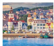
ท่าเรือประมงเหยียนโกะ