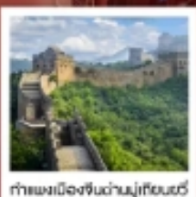
กำแพงเมืองจีนด้านมู่เถียนยวี่