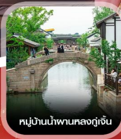
หมู่บ้านน้ำผานหลงกุเจิน